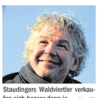
Staudingers Waldviertler verkaufen sich besser denn je.

Die Waldviertler Werkstätten haben 2015 laut Staudinger 18,5 Mio. Euro umgesetzt, die 22-GEA-Schuhgeschäfte, die er selbst betreibt, 12,5 Mio. Euro. Der Gewinn sei bei einer knappen Million Euro vor Steuern gelegen. Die Streitigkeiten mit der FMA seien beendet. (APA)